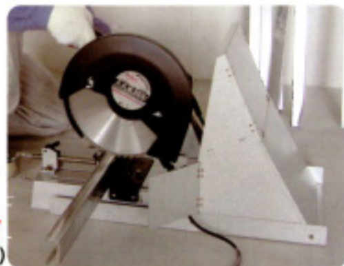
シャットエース II (MTS-355II)

MTS-355に比べ、高い位置での切断火花や、 チップソー切削粉の飛散防止をより確実にする為に、 ワイド遮へい板・遮へいフラップ板を追加、改良致しました。